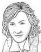
redaktor naczelny „Dziennika Gazety Prawnej”

Jeśli ktoś przegląda ten ranking w poszukiwaniu obecnego ministra sprawiedliwości, uprzedzam: próżny trud. Jarosława Gowina tu nie ma, mimo że to on dziś ma formalnie największy wpływ na środowiska prawnicze. Powód bardzo prozaiczny – jest filozofem, a nie prawnikiem. A ranking obejmuje wyłącznie ludzi z dyplomem wydziału prawa. Ich dobór i kolejność nie wynika z żadnych konkretnych kryteriów czy realnych wskaźników. Nie ma tu żadnego innego klucza niż opinie naszej redakcji.